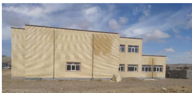
خانه فرهنگ و