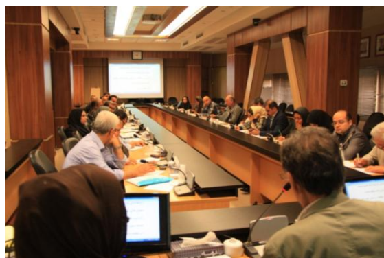
جلسات هم‌اندیشی با جامعه حرفه‌ای در خصوص تدوین شرح خدمات بازآفرینی محدوده‌های ناکارآمد شهری

این شیوه‌نامه که به دلیل عدم تکلیف شرح خدمات صلب، انعطاف‌پذیری لازم برای انطباق با شرایط زمینه‌ای و ویژگی‌ها و مسائل متفاوت شهرها را دارد، به منظور بهبود و ارتقای محتوا، رویه‌ها و روندهای مواجهه با بافت‌های ناکارآمد شهری به‌گونه‌ای که در انطباق با رویکرد بازآفرینی بوده و بتواند منجر به اقدامات بازآفرینی پایدار در محدوده‌ها و محلات ناکارآمد شهری شود، تدوین شده است.