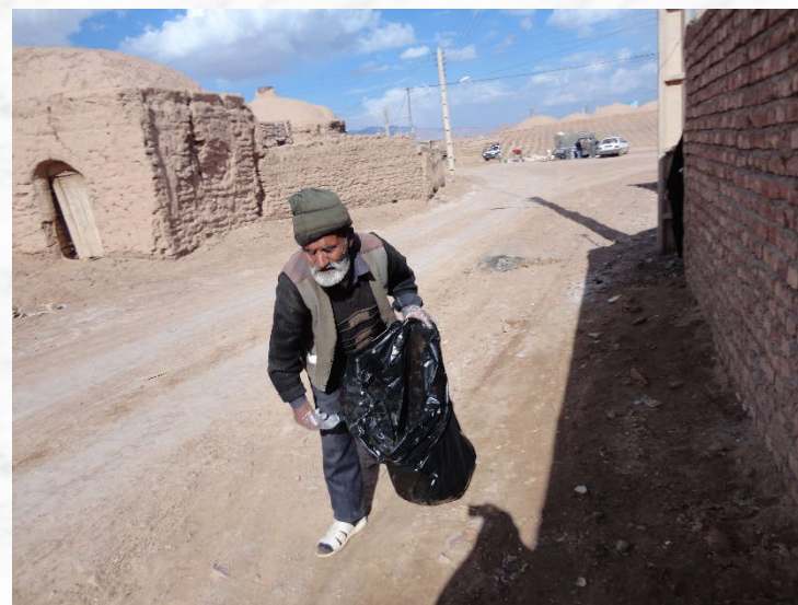
زمینه سازی جهت مشارکت جامعه محلی در حفظ محیط زیست روستا