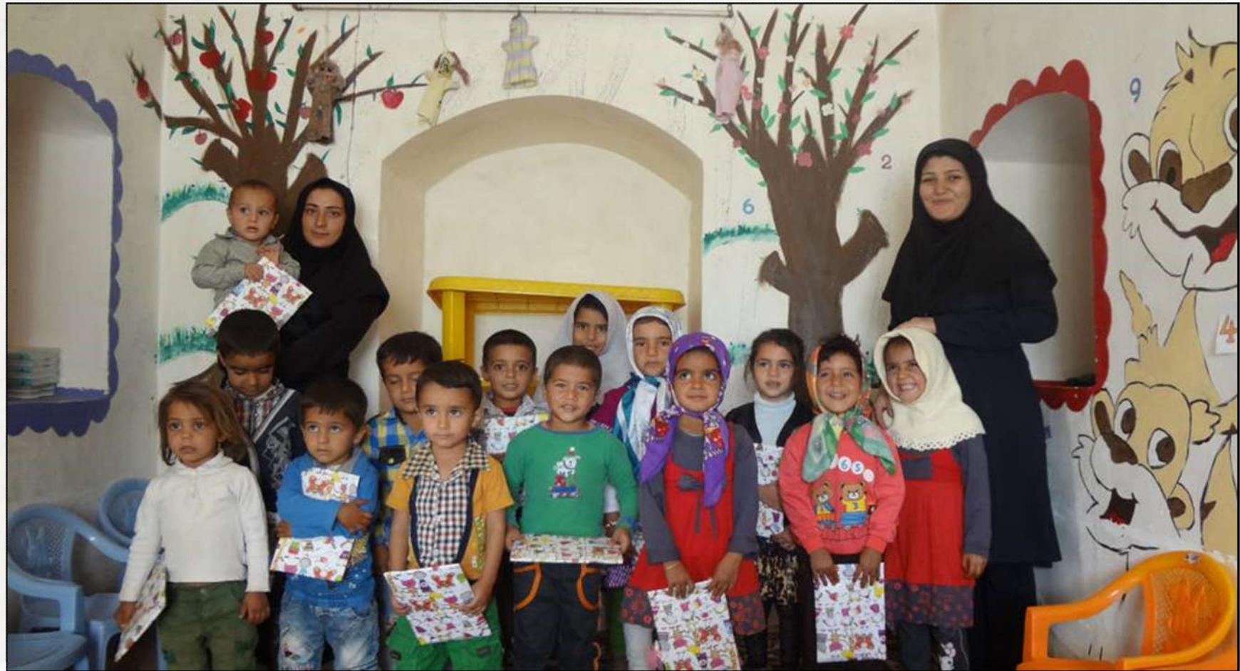
تغییر کاربری حمام قدیمی روستا به مهد کودک