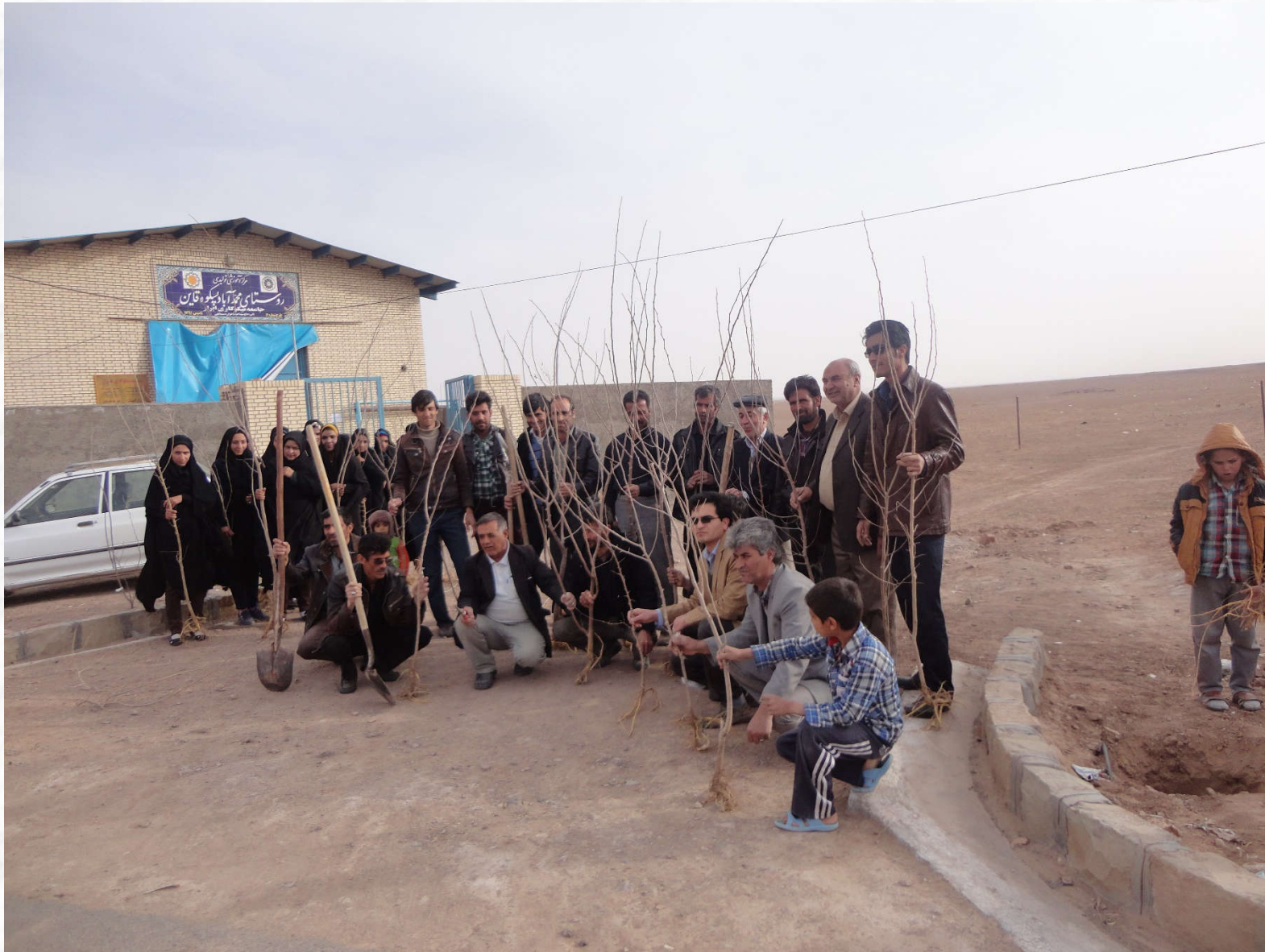
روز خوب درختکاری در روستای محمدآباد پیکوه