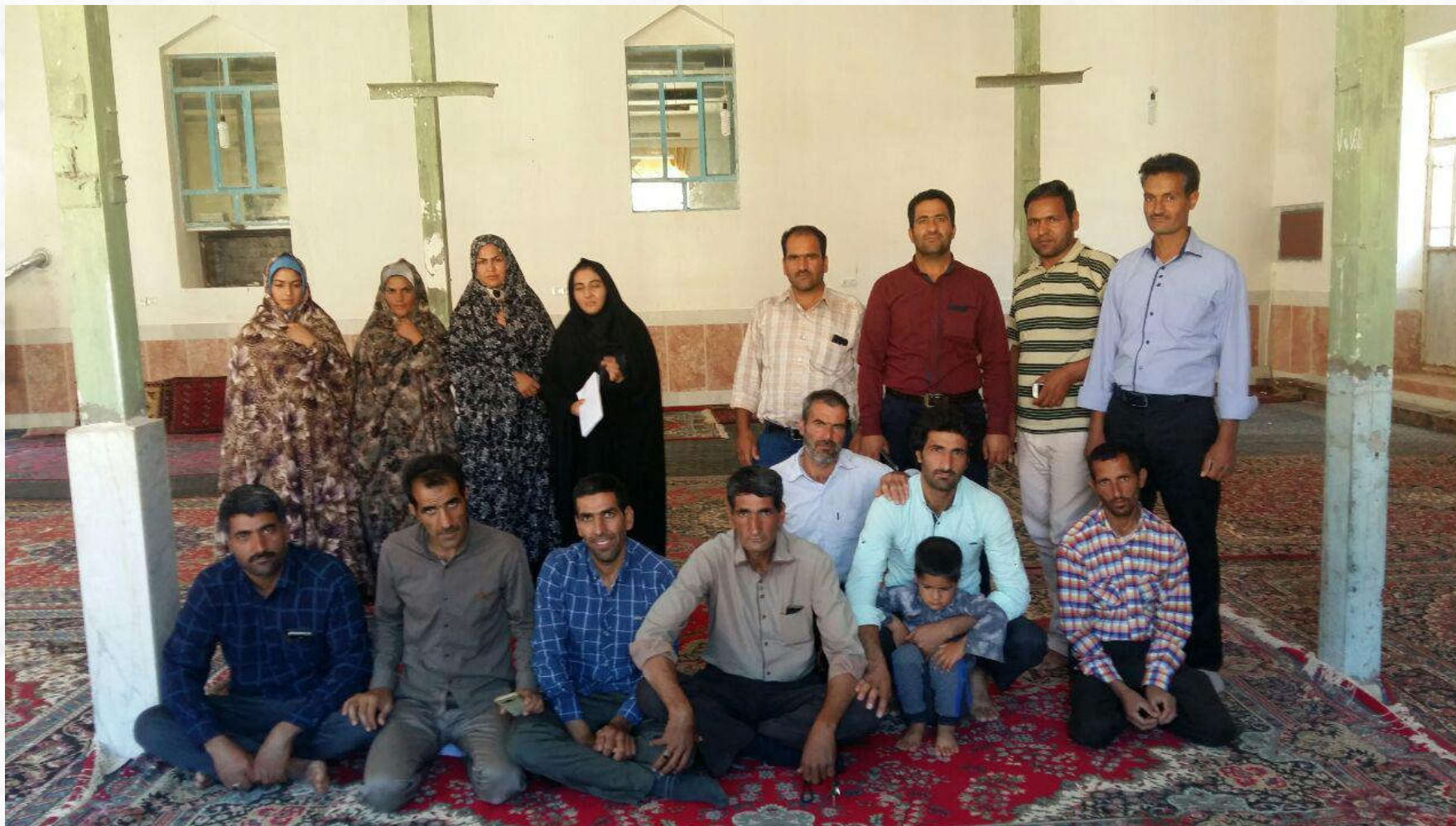
ستاد برنامه ریزی روستا؛ نهادی توسعه ای