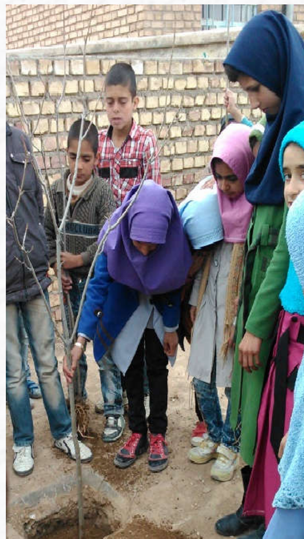
روز خوب درختکاری؛ روزی برای کودکان روستا