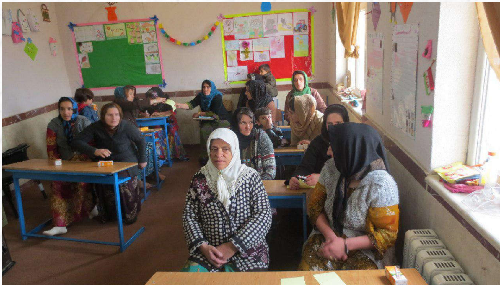
نخستین حضورشان در کلاس درس؛ بیش از ۵۰ درصد زنان روستای کوسمنبر کردستان بی سوادند.