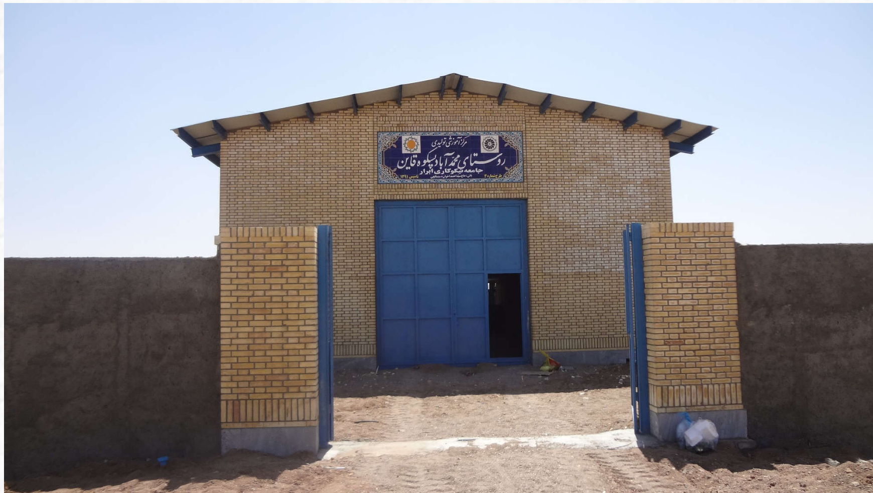
ایجاد، تکمیل و بهسازی فضاهای آموزشی روستا